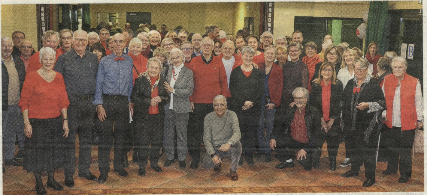
La quasi-totalité des bridgeurs s'est retrouvée autour des bougies commémorant les 40 ans d'existence de leur club.

Réunis à Surville, la centaine d'adhérents que compte aujourd'hui le club s'est retrouvée pour jouer, mais aussi pour fêter son 40 e anniversaire. Toute une histoire.